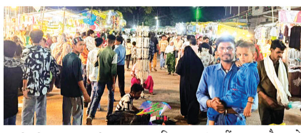
अशोकनगर

नगर में प्रतिवर्ष की भांति इस वर्ष भी दरगाह हजरत मखदूम शाह विलायत पर आयोजित 153वें तीन दिवसीय उर्स का समापन हो गया। 27 अप्रैल से शुरू हुए इस उर्स में बड़ी संख्या में जायरीन ने शिरकत की और बाबा की दरगाह पर फूल एवं चादर पेश कर दुआएं मांगी। मान्यता है कि जो भी भक्त सच्चे दिल से बाबा मखदूम शाह विलायत से दुआ मांगता है, उसकी मुराद अवश्य पूरी होती है।