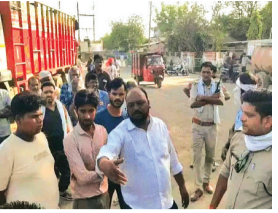
हरिभूमि न्यूज | अशोकनगर