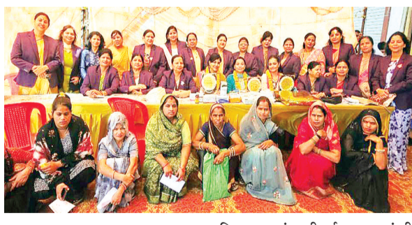
हरिभूमि न्यूज | अशोकनगर

निःशुल्क दवाइयों प्रदान की गईं और मौसमी बीमारियों से बचने की सलाह दी गई। हरिभूमि न्यूज | अशोकनगर